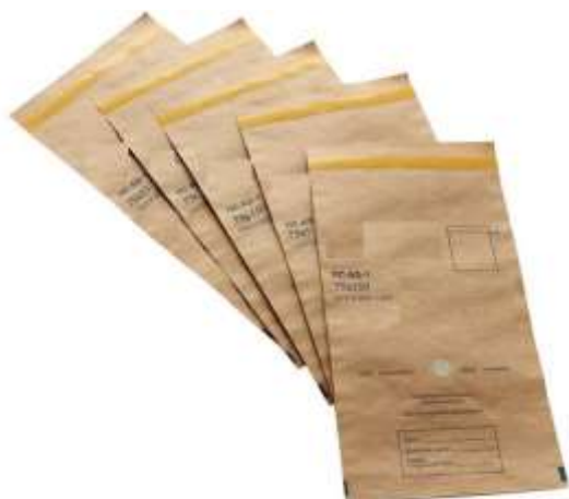
Крафт-пакет для лотка